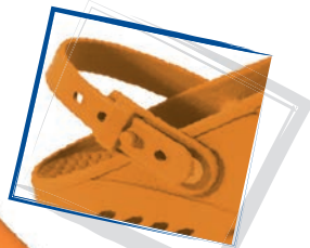
CINTURINO MOBILE MOVABLE STRAP

FORI LATERALI DI AERAZIONE LATERAL PORES FOR BREATHABILITY